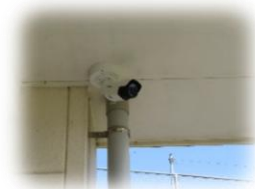
玄関・園庭も安心