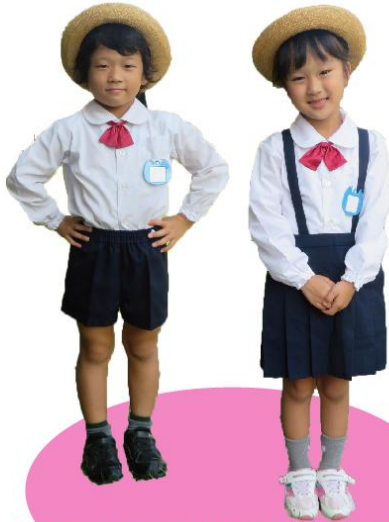
春から夏にかけての中間服