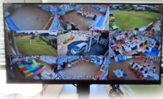
職員室でチェック

不審者の侵入への抑止力のため、玄関と園庭に、また、万がーの事故やトラブルが発生した際に迅速な対応が取れ、子どもたちをしっかりと見守ることができるように、各クラスにも防犯カメラを設置しており、安心してお子様を預けていただける環境づくりに努めております。