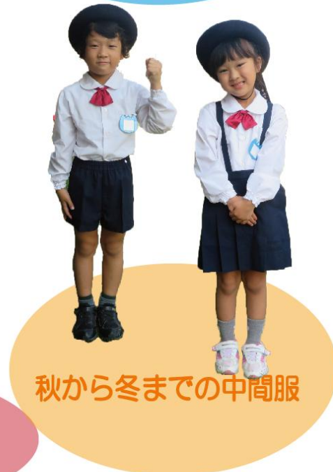
秋から冬までの中間服